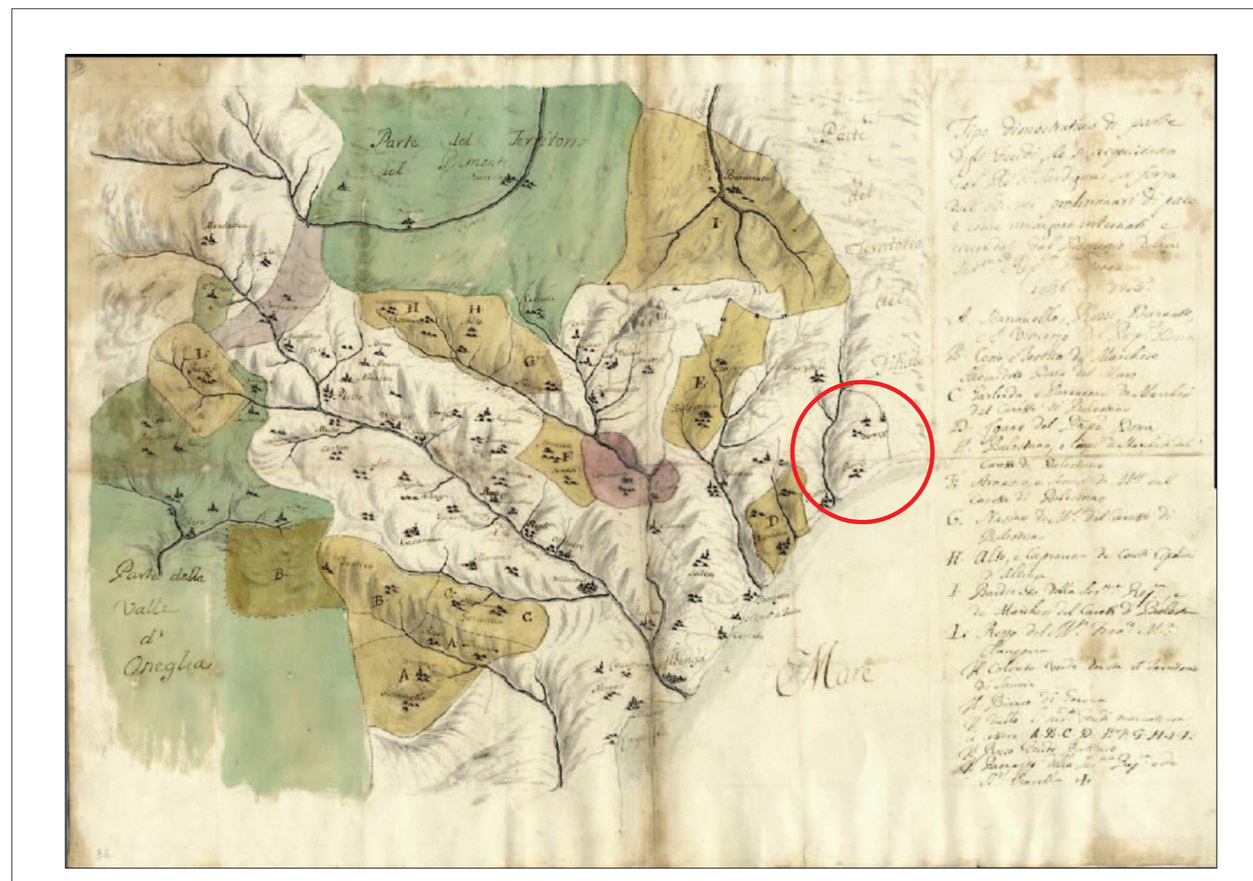
“Tipo dimostrativo di parte degli Feudi che si acquistano dal re di Sardegna in forza dell'odierni preliminari di pace e come rimangono internati e circondati dal Dominio della Serenissima Repubblica di Genova” (1736 set). (Archivio di Stato di Genova, 210, Feudi imperiali).