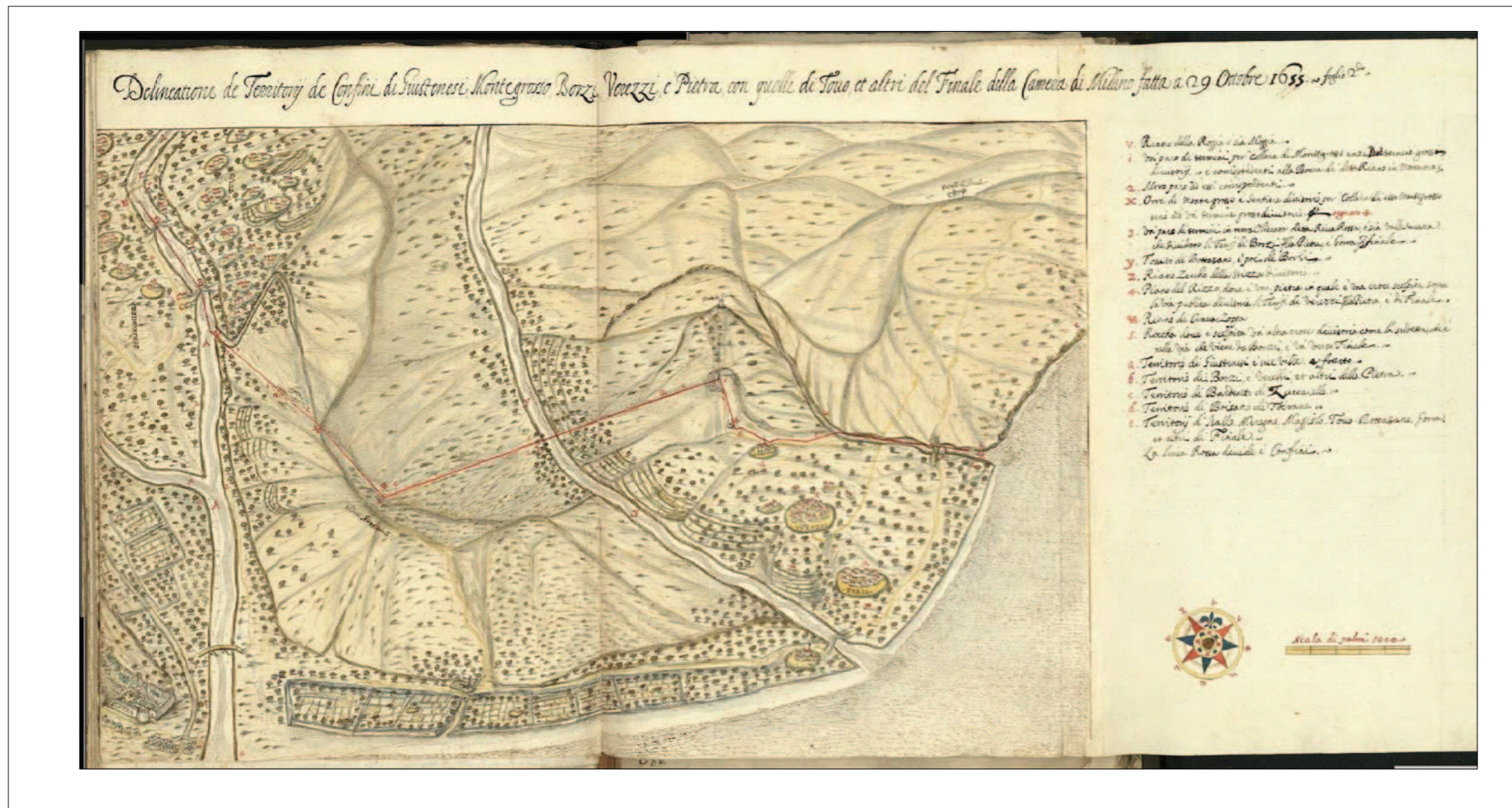
“Delineazione de territorij de confini tra li territorij di Giustenesi, Montegrosso, Borzi, Verezzi e Pietra con quelli di Tovo et altri del Finale della Contea di Milano fatta a 29 ottobre 1655”. (Archivio di Stato di Genova, 36).