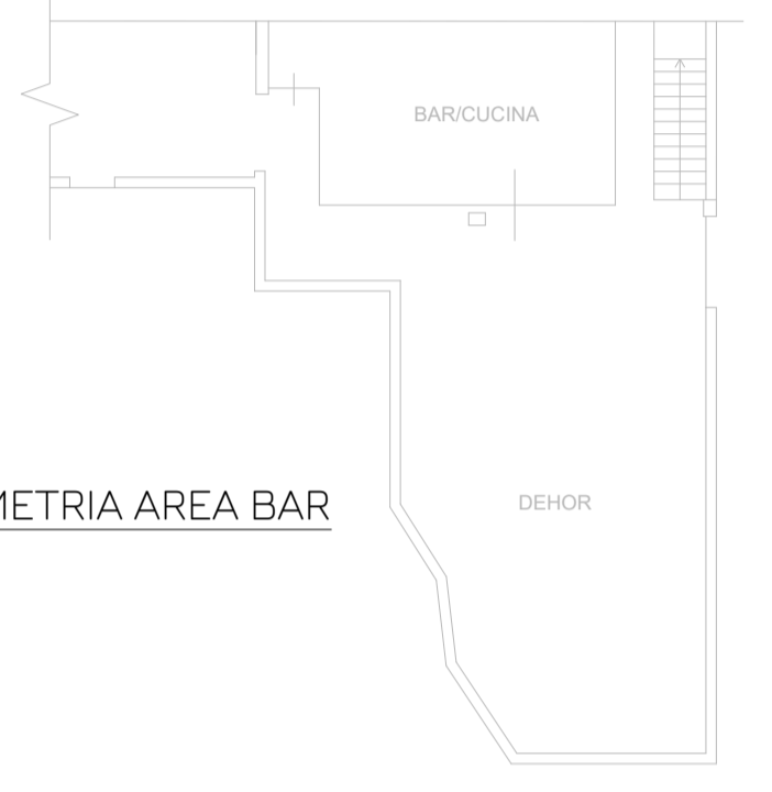
PLANIMETRIA AREA BAR